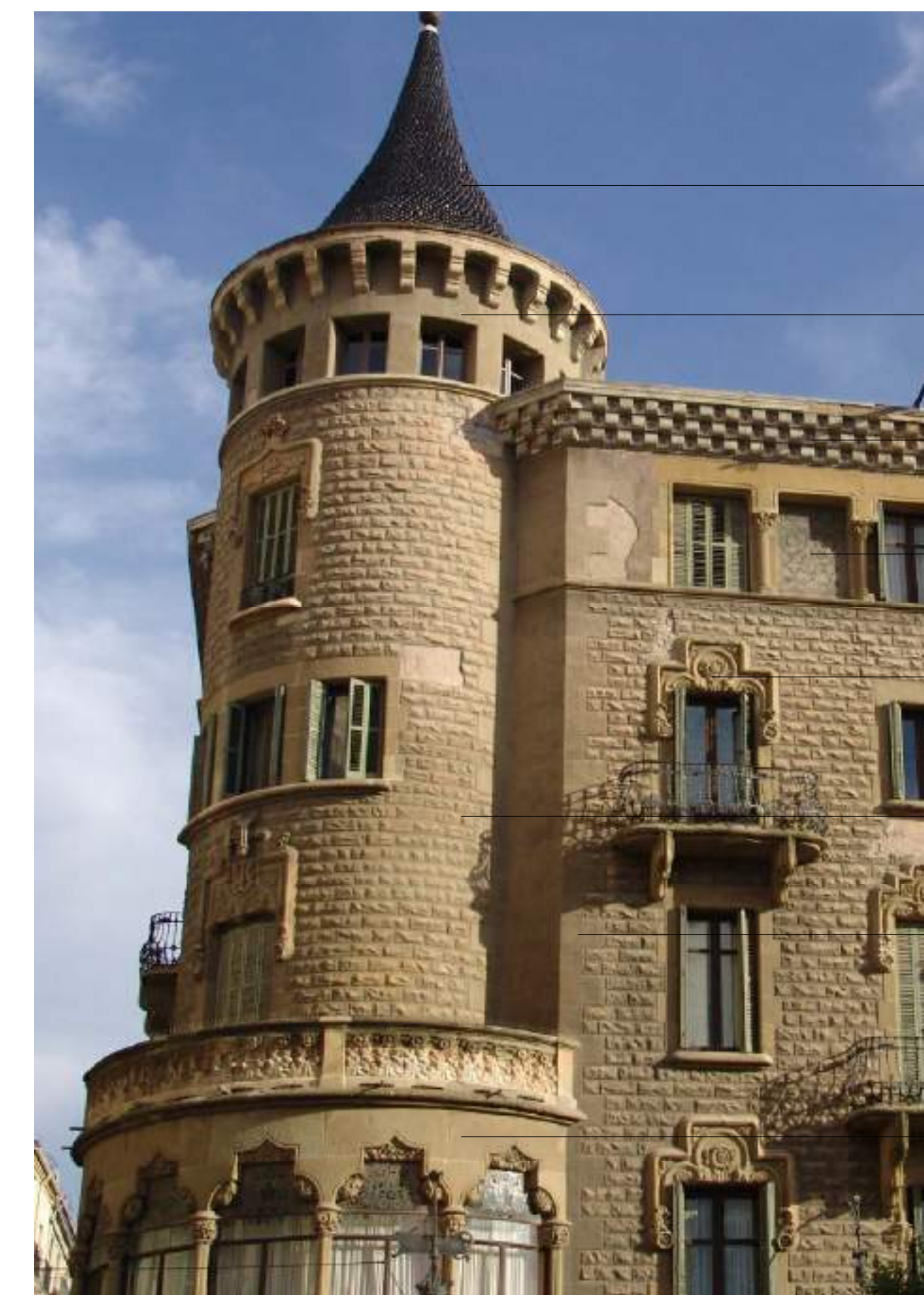
FOTOGRAFIA CANTONADA C/ BORN I PLAÇA FIUS I PALÀ