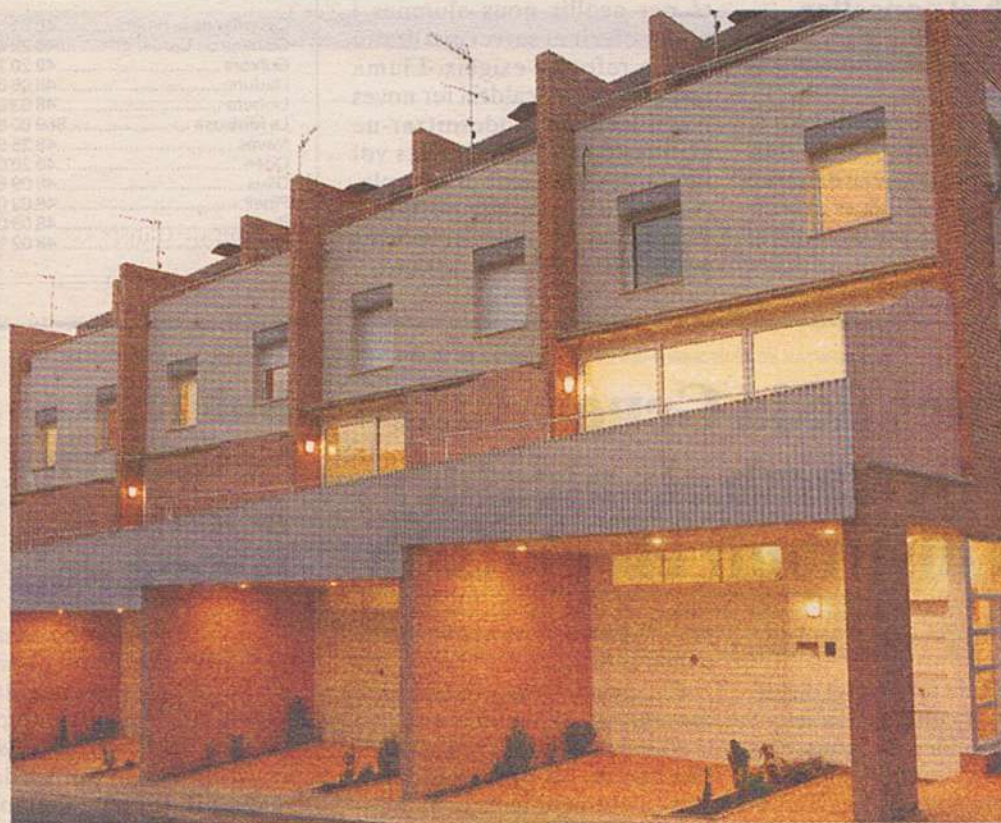
Façana posterior a zona verda