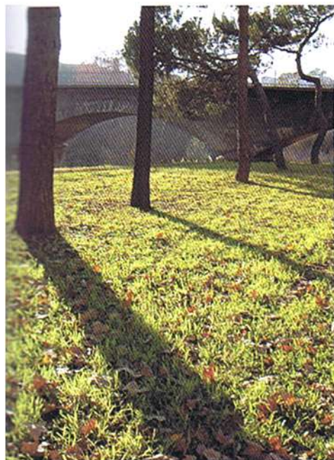
Contrallum del pont en un capvespre de tardor.