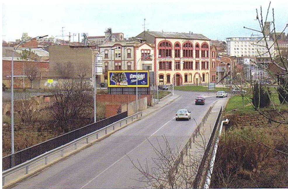
Des del pont del Congost es pot observar en primer terme el monument al Mil·lenari de Catalunya amb l'obra Paula d'Enric Pladevall (1989). A la seva esquerra la farinera Albareda (1909) obra d'Alexandre Soler i March, al fons l'hotel Pere III (1969) i el campanar de la Seu.