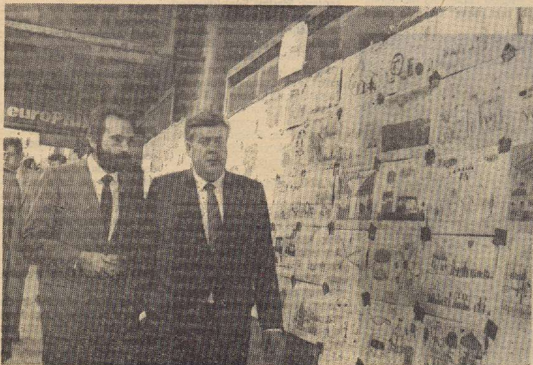
Uns dos mil cinc-cents dibuixos infantils s'exposaren a can Jorba.

En definitiva, una fira amb estira-i-arronses, però molt positiva per la intenció de les iniciatives, que van assolir la presència de l'art a la Fira de Sant Andreu-84. Rafael L. Pozo