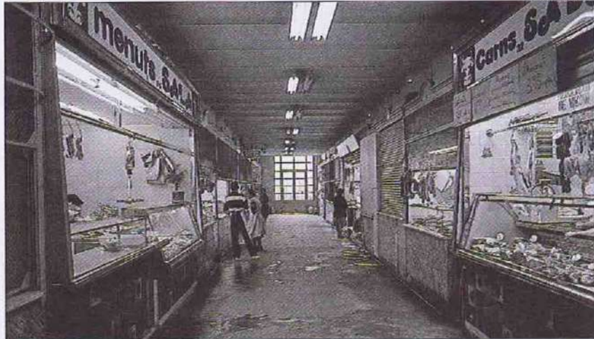
Interior del mercat municipal de les Mandongueres quan encara funcionava