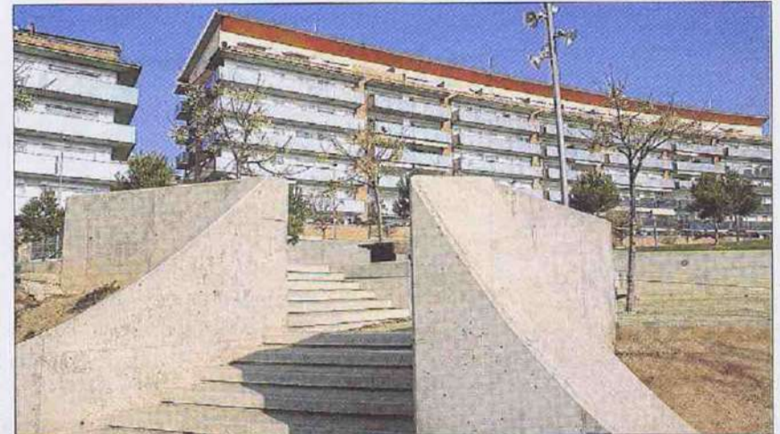
Pisos i una plaça amb parc infantil, zona verda i bancs ocupen l'espai de la foneria