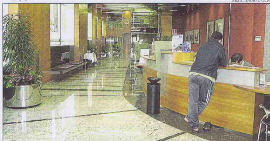
Després de molts anys, l'activitat va tornar a can Jorba. A la foto, el local de Caixa Penedès