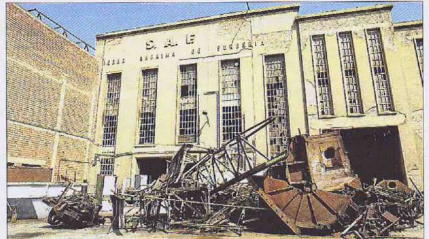
La SAF en una imatge de l'11 d'agost del 1995. Feia tres anys que havia tancat