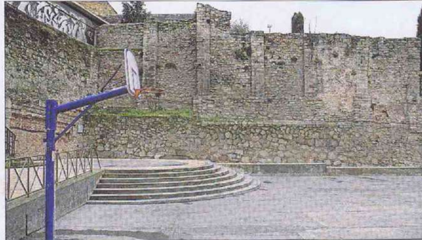
La plaça d'Europa amb les escales en forma de graderia i un pany de la muralla