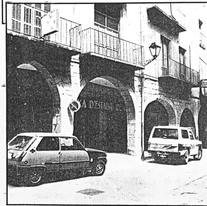
Vista frontal des de la Plaça del Mercat. A baix, l'estat de les porxadades

construïdes amb pedra, encara que no fossin pensades per ser vistes. S'ha de procurar no inventar res, sinó restaurar i acondicionar el que existeix o ha existit, d'acord amb l'esperit de l'època de construcció",