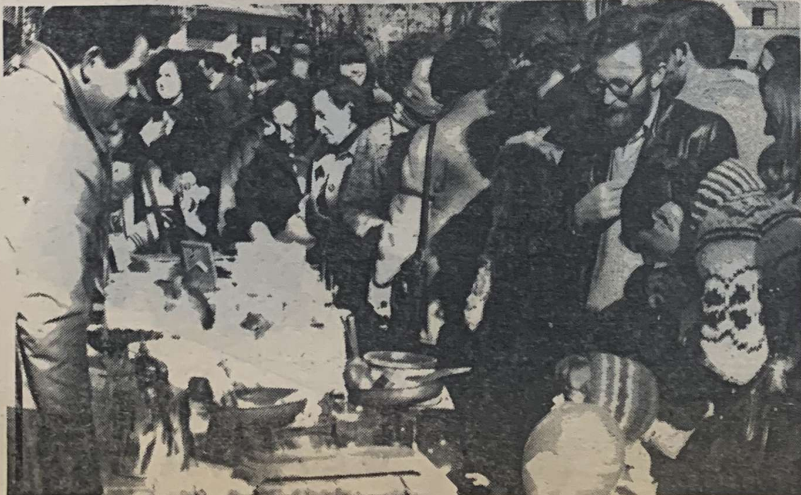
Una mica de tot.